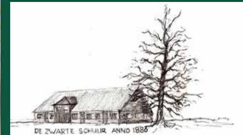
DE ZWARTE SCHUUR ANNO 1886