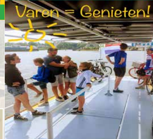
Heerlijk een dagje fietsen.

Nederland is een écht fietsland, maar fietsen in Nationaal Park De Biesbosch kan lastig zijn. Het gebied bestaat namelijk grotendeels uit water en nat land. Er zijn onverharde paden voor wandelaars, maar geen verbindingswegen of bruggen. In de Biesboschregio – het gebied rondom het Nationaal Park – kan je wel goede en mooie fietstochten maken, langs polders, weilanden, akkers, rivieren en lintdorpen. Kies je route en ga op ontdekking!