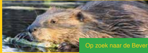
Op zoek naar de Bever!

Al meer dan 25 jaar aanwezig in de Biesbosch en nog steeds volop in de belangstelling; de Bever. Op zoek naar Bevers? Dat Kan! Rustig peddel je door de Biesbosch-jungle onder leiding van een gids. Je vaart met de kano door de kleinere Biesboschkreken en gaat op zoek naar beversporen. En met een beetje geluk heb je een ontmoeting met een bever! Kijk voor meer informatie op: www.np-debiesbosch.nl Speciaal voor de natuurliefhebbers organiseren we in het late voorjaar en hoogzomer de Bevertochten. Kan jij deze bekende Biesbosch bewoners spotten?